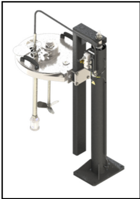
Version 20—40 litres